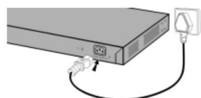
Подключение питания AC 100~240В